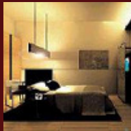
Accommodation and meetings